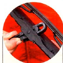
Die meisten Wischerblätter werden noch von herkömmlichen Clips gehalten