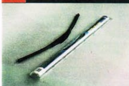
14 место TRICO NeoForm

Заявленный производитель ..... согласно упаковке – Мексика, но на наклейке написано «Англия»... Ориентировочная цена, руб. 680 + 500 (продаются поштучно)